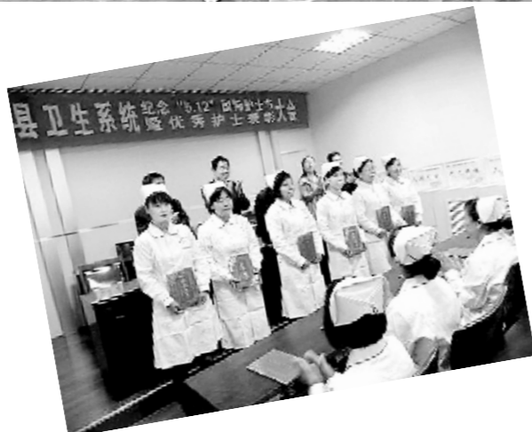
↑孟津县召开了优秀护士表彰大会。