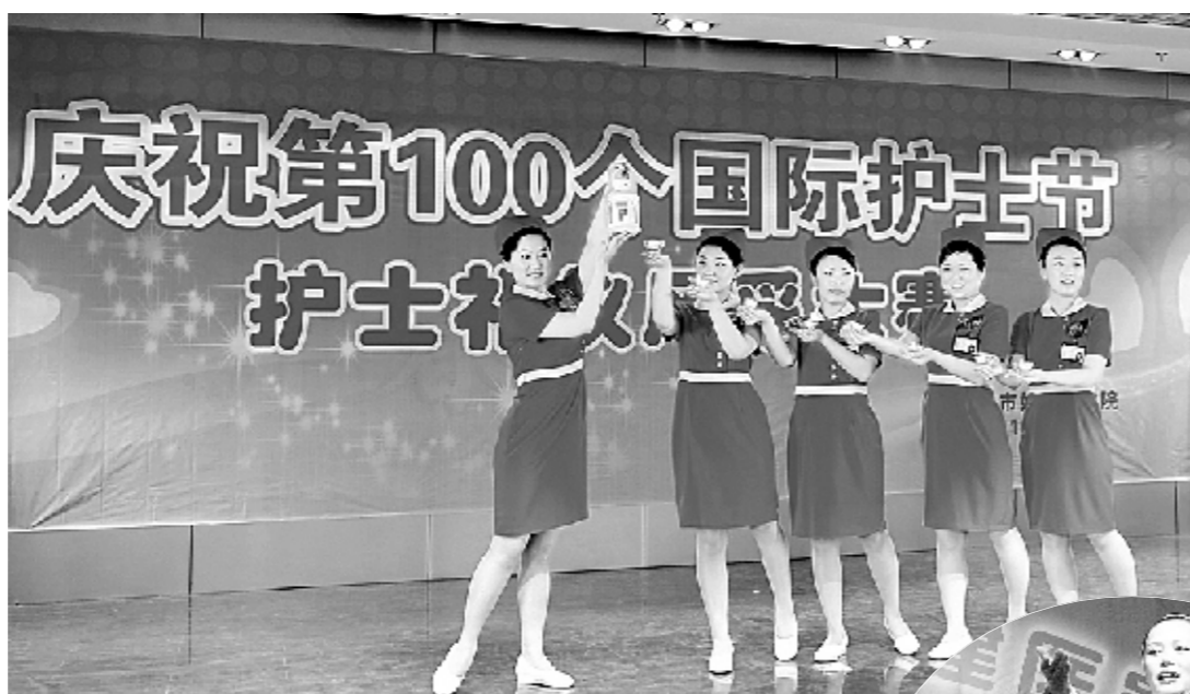
←郑州市妇幼保健院举行护士礼仪风采大赛。

据悉，许昌市职业技术学院无偿献血志愿服务队成立以来，参与无偿献血的同学已达5000余人(次)，累计献血量达191.2万毫升。据了解，许昌市中心血站注资两万元启动爱心助学基金，旨在帮助广大需要帮助的优秀学生，使他们能够更好地完成学业，用自己的实际行动和优异成绩回报社会。