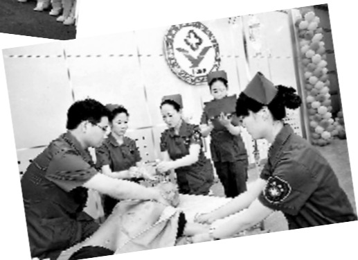
←新乡医学院第一附属医院组织了院前院内多人、双人心肺复苏急救技能大赛。