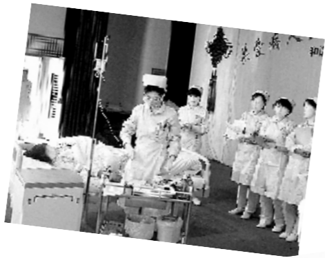
↑河南省胸科医院优质护理示范病区的护士在为患者做基础护理。